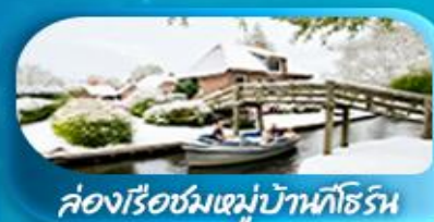
ล่องเรือชมหมู่บ้านอิธรีน

พิเศษ ล่องเรือแม่น้ำแซน ชมเมือง โดย บาโต มูช