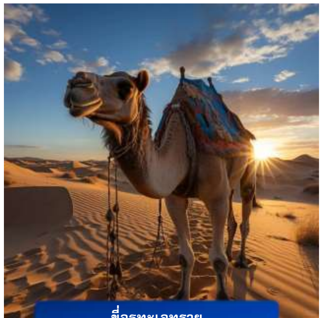
ซีอูรูทะเลทราย

ที่พัก MEHOOD LESTIE HOTEL เทียบเท่าหรือระดับ 4 ดาวท้องถิ่น