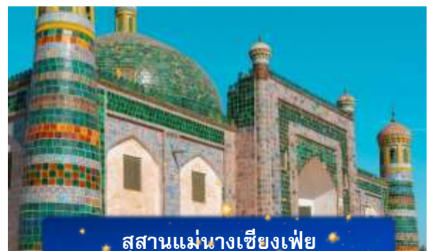
สุสานแม่นางเซียงเฟย

ที่พัก LANOU HOTEL เทียบเท่าหรือระดับ 4 ดาวท้องถิ่น