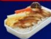
ข้าวหน้าไก่ย่างเกาหลี

บริการอาหารร้อน และ น้ำดื่ม บนเครื่อง ขาไป และ ขากลับ