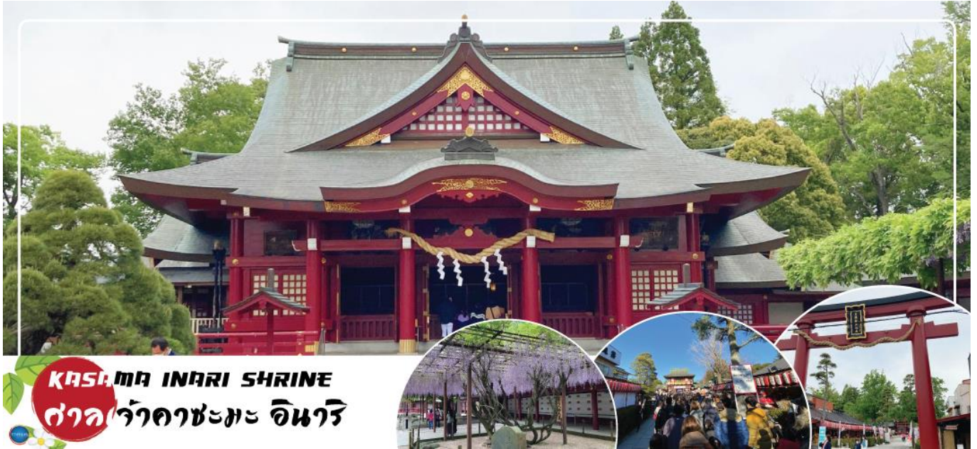
KASAMA INARI SHRINE ศาลเจ้าคาซมะอินาริ

เมืองอิบารากิ-ศาลเจ้าคาซมะอินาริ-จังหวัดไซตามะ-ย่านเมืองเก่าคาวาโกเอะ- ตรอกลูกกวาด-จังหวัดยามานาชิ-หมู่บ้านโอชิโนะสึคิไค-ออนเซ็น+ชาบูยักษ์