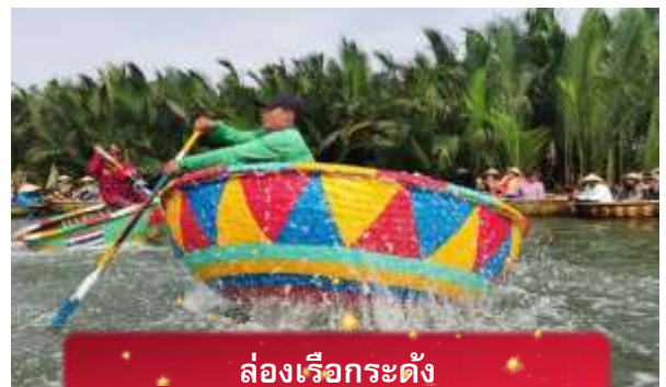
ล่องเรือกระดิ่ง

เช้า บริการอาหารเช้า ณ ห้องอาหารของโรงแรม นำท่านเดินทางสู่ หมู่บ้านกัมทาน เพื่อนำท่าน ล่องเรือกระดิ่ง หมู่บ้าน เล็กๆในเมืองฮอยอันตั้งอยู่ในสวนมะพร้าวริมแม่น้ำ ในอดีตช่วงสงคราม หมู่บ้านแห่งนี้เคยเป็นที่พักอาศัยของทหาร อาชีพหลักของคนที่นี่หมู่บ้านแห่ง นี้คือประมง ระหว่างการล่องเรือท่านจะได้ชมวัฒนธรรมของชาวบ้าน ณ หมู่บ้านแห่งนี้ สามารถให้ทิปได้ตามความพอใจของท่าน จากนั้นนำท่านเดินทางสู่ เมืองโบราณฮอยอัน เมืองมรดกโลกที่ยังคง เอกลักษณ์และรักษาวัฒนธรรมไว้อย่างดีเยี่ยม โดยท่านสามารถเดินเล่น ถ่ายรูป ตามตรอกซอกซอยต่างๆ ได้ ไฮไลท์ของการมา ถ่ายรูปเช็คอินที่นี้คือการได้ขึ้นไปถ่ายรูปจากมุมสูงของคาเฟ่ที่อยู่ตามซอกซอย ได้ทั้งวิว ได้ทั้งชิมกาแฟรสชาติออริจินัลของเวียดนาม