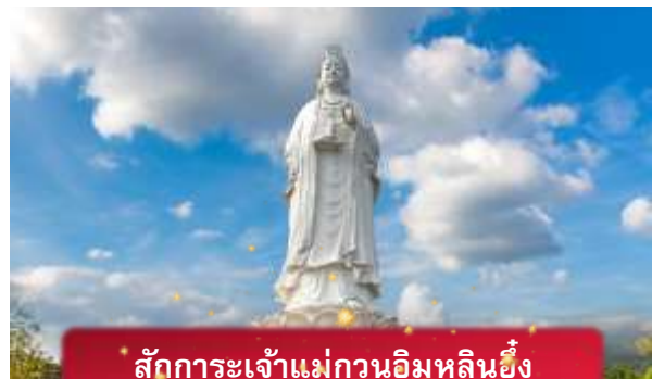
สักการะเจ้าแม่กวนอิมหลินอึ้ง