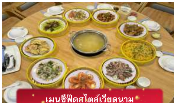
เมนูซีฟู้ดสไตล์เวียดนาม

17.05 เดินทางถึง สนามบินสุวรรณภูมิ โดยสวัสดิภาพ ... พร้อมความประทับใจ