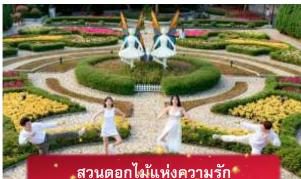
สวนดอกไม้แห่งความรัก