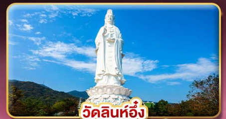
วัดลินท้อจ้