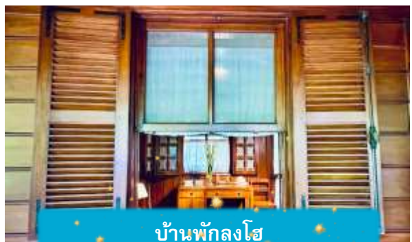
บ้านพักลุงโฮ