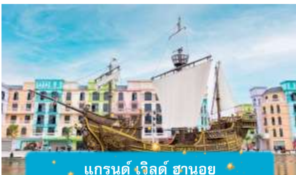
แกรนด์ เวิลด์ ฮานอย