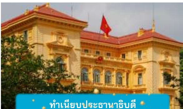
ทำเนียบประธานาธิบดี

เช้า บริการอาหารเช้า ณ ห้องอาหารของโรงแรม นำท่านถ่ายรูปด้านนอก สุสานโฮจิมินห์ จุดเริ่มต้นของการเข้าใจเวียดนาม สถานที่อันเงียบสงบที่สะท้อนจิตวิญญาณของผู้นำผู้ยิ่งใหญ่ สุสานแห่งนี้ไม่ได้เป็นเพียงอนุสรณ์ แต่คือบทเรียนประวัติศาสตร์ที่สัมผัสได้จริง นำท่านเดินทางสู่จุดศูนย์กลางแห่งประวัติศาสตร์เวียดนาม นำชมด้านนอก ทำเนียบประธานาธิบดี อาคารสีเหลืองอร่ามในสไตล์ฝรั่งเศส ที่ยังคงใช้ในพิธีการสำคัญของชาติและชม บ้านพักลุงโฮ บ้านไม้เรียบง่ายริมสระบัว ที่เผยให้เห็นชีวิตสมณะของผู้นำผู้ยิ่งใหญ่ "โฮจิมินห์" สองสถานที่ที่ สองเรื่องราวที่สะท้อนความเป็นเวียดนามอย่างลึกซึ้ง ไม่ใช่แค่ท่องเที่ยว แต่คือการเข้าใจจิตวิญญาณของประเทศนี้อย่างแท้จริง เที่ยง บริการอาหารกลางวัน ณ ภัตตาคาร