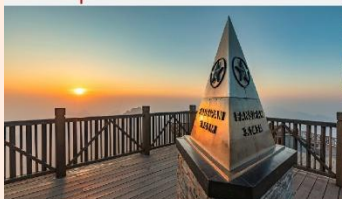
ฟานซิปัน