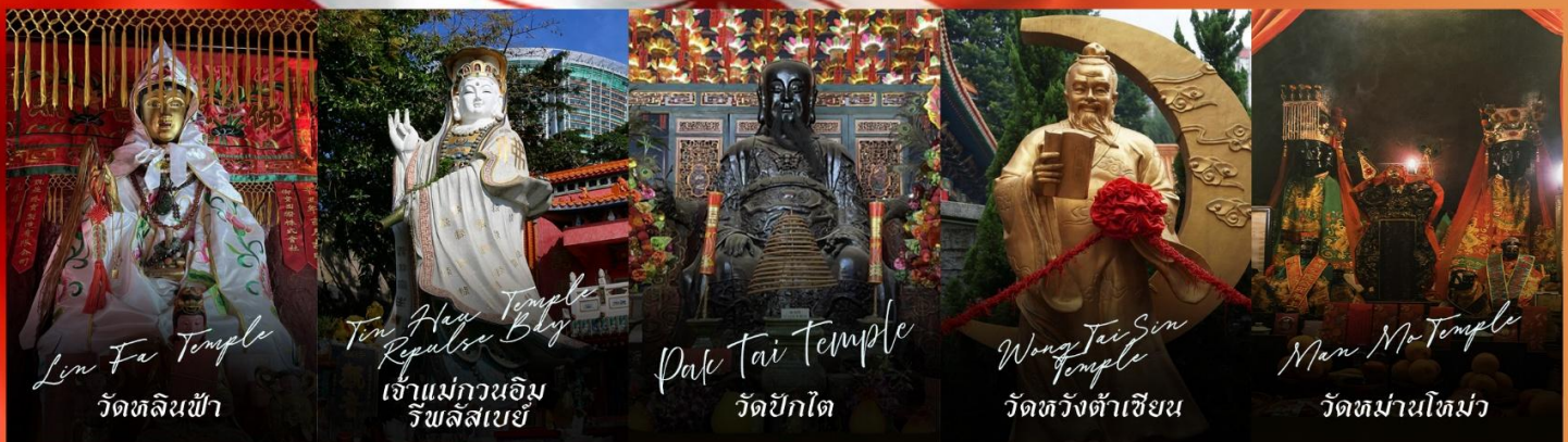
Lin Fa Temple วัดหลินฟ้า

รายการทัวร์ข้างต้นอาจมีการปรับเปลี่ยนเพื่อความเหมาะสม