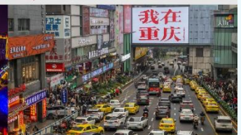
กวนอิมเจียว

*ทางบริษัทฯ ขอสงวนสิทธิ์ในการสลับโปรแกรมทัวร์ตามความเหมาะสมขึ้นอยู่กับสถานการณ์หน้างาน โดยคำนึงถึงผลประโยชน์ของลูกค้าเป็นสำคัญ