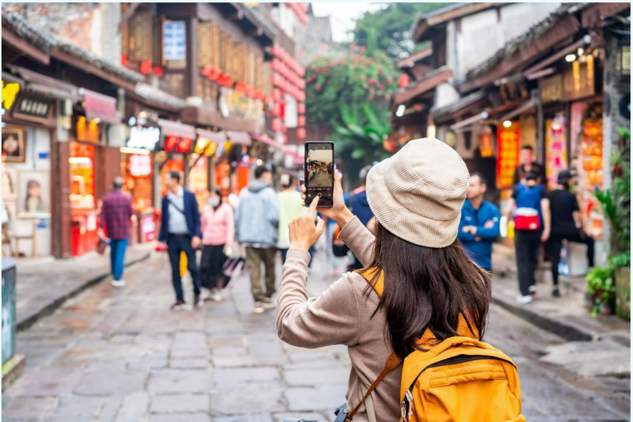
กลางวัน บริการอาหารกลางวัน ณ ภัตตาคารอาหารพื้นเมือง

จากนั้นนำท่านเดินทางสู่ หมู่บ้านโบราณฉือโข่ว (Ciqikou Ancient Town) เป็นหมู่บ้านอนุรักษ์ทางวัฒนธรรม และเป็นสถานที่ท่องเที่ยวชื่อดังของมหานครฉงชิ่ง ลักษณะก็คล้ายๆ กับตลาดเก่าหรือตลาดโบราณบ้านเรา สำหรับคนที่อยากไปย้อนเวลากลับไปในอดีตก็ต้องไปเยือน เพราะที่นี่ยังคงรักษาวิถีชีวิต รวมทั้งสะท้อนรากเหง้าดั้งเดิมของเมืองไว้ได้อย่างดีเยี่ยม ไม่ว่าจะเป็นตึกoramบ้านช่องที่มีรูปทรงโบราณ แหล่งผลิตสินค้า และอาหารพื้นเมืองที่สืบทอดกิจการต่อกันมาหลายรุ่น