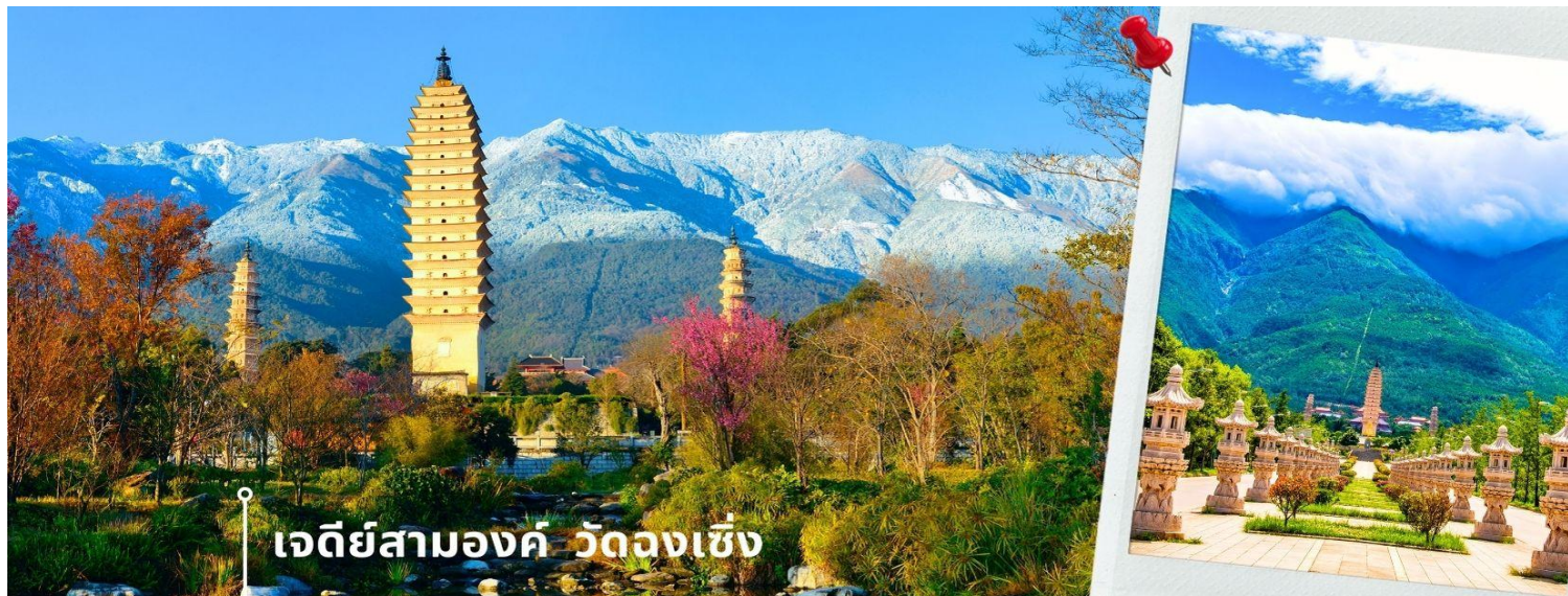
เจดีย์สามองค์ วัดจงเซิ่ง

จากนั้นผ่านชม เจดีย์สามองค์ สัญลักษณ์ของเมืองต้าหลี่ ตั้งอยู่ใน วัดจงเซิ่ง (Chongsheng Temple) วัดเก่าแก่ที่สร้างขึ้นเมื่อศตวรรษที่ 9 นับว่าเป็นหนึ่งในเจดีย์ที่สูงที่สุดในประเทศจีน อีกทั้งยังมีความศักดิ์สิทธิ์เป็นอย่างมาก ว่ากันว่าเป็นหนึ่งในสิ่งก่อสร้างเพียงไม่กี่แห่งที่ไม่ถูกทำลายจากเหตุการณ์แผ่นดินไหวในเมืองต้าหลี่เมื่อปี ค.ศ. 1925 จึงกลายเป็นสถานที่เคารพศรัทธาของชาวต้าหลี่เป็นอย่างมาก