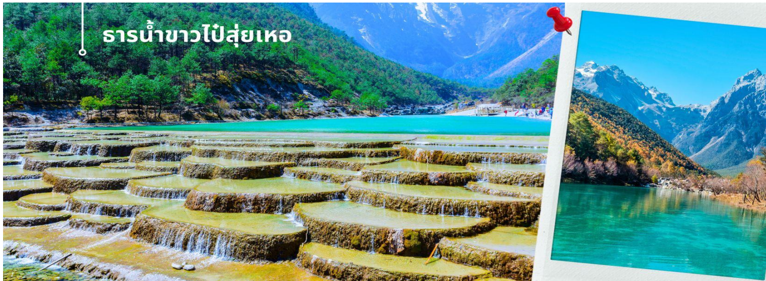
ธารน้ำขาวไปสู่ยเหอ

นำท่านชม ธารน้ำขาวไปสู่ยเหอ หรือ ทะเลสาบไปสู่ยเหอ (รวมค่าบริการรถแบดเตอร์) ทะเลสาบสีเทอร์ควอยซ์ตัดกับ วิวต้นไม้ท่ามกลางขุนเขาแห่งหุบเขาพระจันทร์สีน้ำเงิน ฉากของภูเขาหิมะมังกรหยก มีน้ำตกหินปูนชั้นบันไดขนาดเล็ก ลดหลั่นลงมาอย่างสวยงาม น้ำที่ไหลผ่านหุบเขานี้คือน้ำที่ละลายจากหิมะบนยอดเขาหิมะมังกรหยก เนื่องจากจุดนี้มี ทิวทัศน์ที่สวยงามมีฉากหลังคือภูเขาหิมะมังกรหยกมีน้ำตกและแม่น้ำกึ่งทะเลสาบจึงเป็นที่นิยมของนักท่องเที่ยว ช่างภาพและคู่รักเป็นอย่างมาก อีสระเก็บภาพประทับใจตามอัธยาศัย