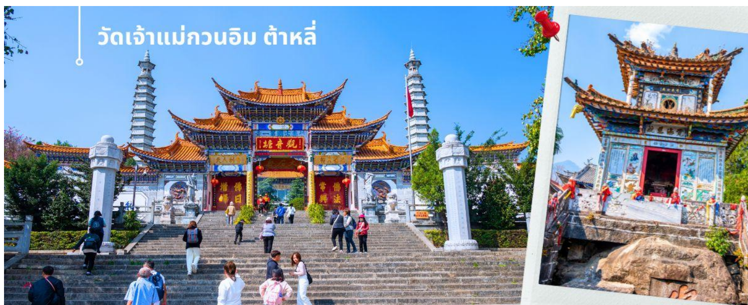
วัดเจ้าแม่กวนอิม ต้าหลี่

เช้า ๑๐ รับประทานอาหารเช้า ณ ห้องอาหารโรงแรม (4) นำท่านชม วัดเจ้าแม่กวนอิม (ใช้เวลาเดินทาง 30 นาที) ตามตำนานเล่าว่าเจ้าแม่กวนอิมได้แปลงกายเป็นหญิงชราแบก ก้อนหินใหญ่ไว้บนหลังเพื่อให้ทหารของฝ่ายตรงข้ามได้เห็นเมื่อทหารฝ่ายศัตรูได้เห็นว่ามีแม่แต่หญิงชรายังแข็งแรงถึงเพียง นี้ ถ้าเป็นคนวัยหนุ่มสาวจะต้องมีพลังกำลังมากมายยากที่จะต่อสู้ จึงทำให้ไม่ทำการเข้าโจมตี เมืองและถอยทัพกลับไป ชาวเมืองจึงสร้างวัดแห่งนี้ขึ้นในสมัยราชวงศ์ถัง ซึ่งถือว่าเป็นวัดที่มีประติมากรรมยอดเยี่ยมแห่งหนึ่งในต้าหลี่