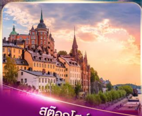
สต็อกโฮล์ม เวนิสแห่งยุโรปเหนือ