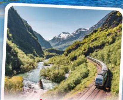
พหลิมส์บานา รถไฟเส้นทางสายโรเมนติก