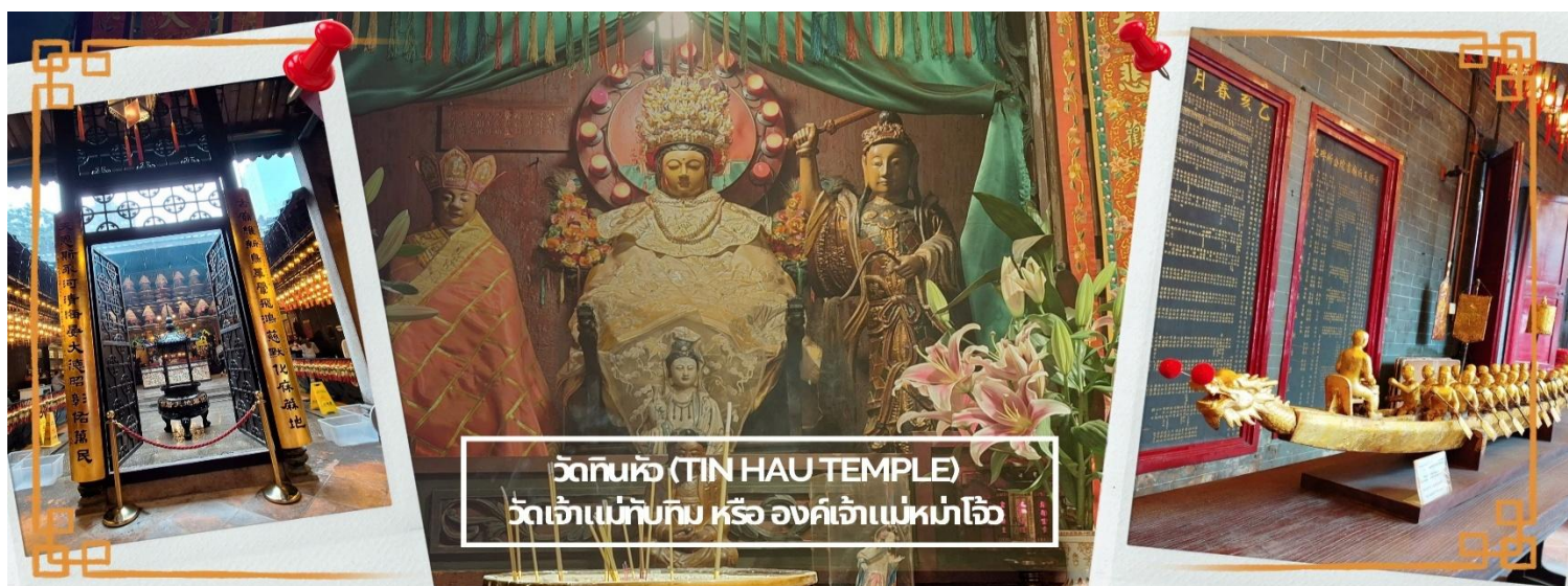
วัดทินหัว (TIN HAU TEMPLE) วัดเจ้าแม่ทับทิม หรือ องค์เจ้าแม่หมาโจ้

จากนั้นนำท่าน ไหว้ขอพรเรื่องเดินทาง การติดต่อ ค้าขาย วัดเจ้าแม่ทับทิมทินหัว (Tin Hau Temple) ที่ Yau Ma Tei เป็นวัดเก่าแก่ขนาดเล็ก อายุกว่า 150 ปี มีต้นกำเนิดมาจากวัดเล็กๆ ใน พื้นที่ตลาด Kwun Chung เคยเป็นหมู่บ้านชาวประมงมาก่อน ตั้งแต่ปี 1864 เป็นวัดที่อุทิศให้กับทินโหว่ (หมาโจ้ เทพเจ้าแห่งท้องทะเล) มีบรรยากาศที่สงบ ร่มรื่น ติดกับสวนสาธารณะเล็ก ๆ และนักท่องเที่ยวยังไม่พรั่งพล่านมากจุดเด่นที่แนะนำคือ การปิดทองเรือมังกร เพื่อการงานการค้า ธุรกิจ ให้เจริญรุ่งเรือง