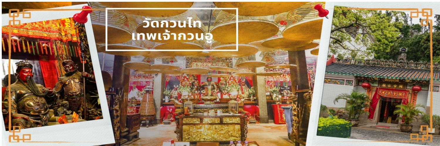
วัดกวนโต เทพเจ้ากวนอู

จากนั้นนำท่าน ไหว้ขอพรเรื่องเดินทาง การติดต่อ ค้าขาย วัดเจ้าแม่ทับทิมทินหัว (Tin Hau Temple) ที่ Yau Ma Tei เป็นวัดเก่าแก่ขนาดเล็ก อายุกว่า 150 ปี มีต้นกำเนิดมาจากวัดเล็กๆ ใน พื้นที่ตลาด Kwun Chung เคยเป็นหมู่บ้านชาวประมงมาก่อน ตั้งแต่ปี 1864 เป็นวัดที่อุทิศให้กับทินโหว่ (หมาโจ้ เทพเจ้าแห่งท้องทะเล) มีบรรยากาศที่สงบ ร่มรื่น ติดกับสวนสาธารณะเล็ก ๆ และนักท่องเที่ยวยังไม่พรั่งพล่านมากจุดเด่นที่แนะนำคือ การปิดทองเรือมังกร เพื่อการงานการค้า ธุรกิจ ให้เจริญรุ่งเรือง