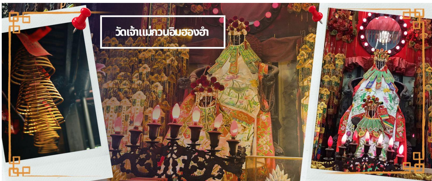
วัดเจ้าแม่กวนอิมสองฮา

จากนั้นนำทุกท่านเดินทางสู่ วัดเจ้าแม่กวนอิมสองฮา (HUNG HOM KWUN YUM TEMPLE) เป็นหนึ่งในวัดที่ชาวฮ่องกงนั้นเลื่อมใสกันมาก ด้วยความที่เจ้าแม่กวนอิมนั้นเป็นเทพเจ้าแห่งความเมตตา ฉะนั้นเมื่อใครมีทุกข์ร้อนอะไรก็มักจะมาราบไหว้ขอพรให้เจ้าแม่ช่วยเหลือ วัดนี้ถูกสร้างขึ้นในปี ค.ศ.1873 ในช่วงสงครามโลกครั้งที่ 2 มีการปล่อยระเบิดลงบริเวณวัดสองฮาหลายต่อหลายครั้ง ทำให้มีผู้บาดเจ็บและล้มตายมากมาย แต่ชาวบ้านที่หนีเข้าไปหลบ