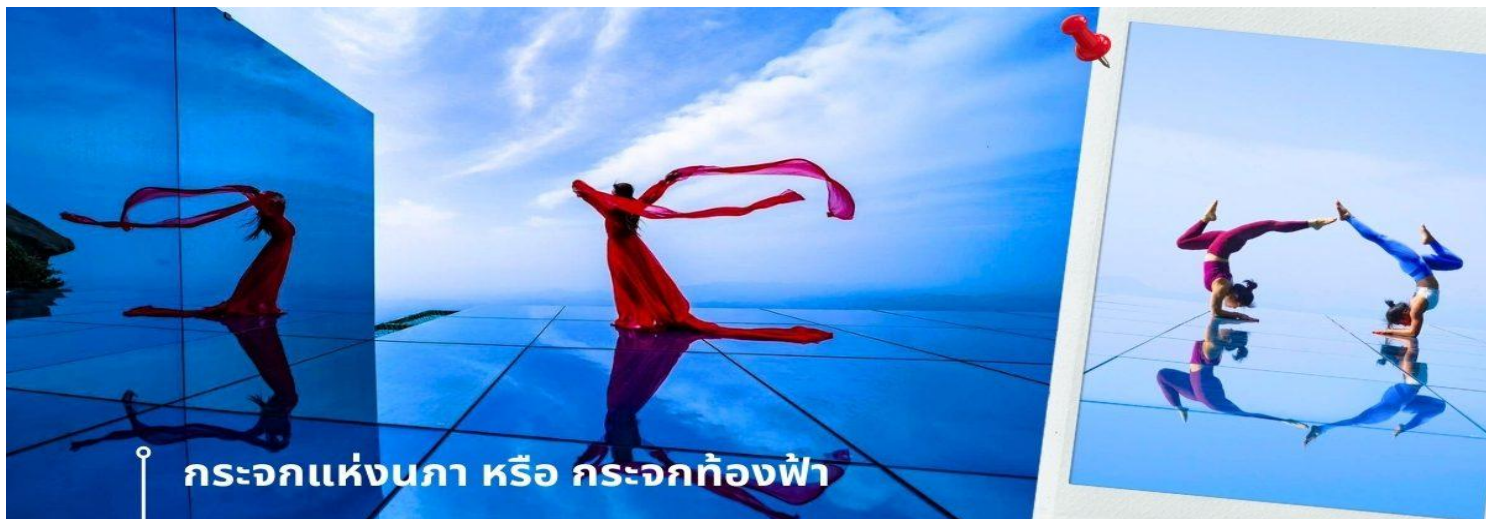
กระจกแห่งนภา หรือ กระจกท้องฟ้า

ตระวันออกเฉียงเหนือของมณฑลเจียงซี จากนั้นพาท่านถ่ายภาพความสวยงามของหุบเขาหลิงชาน ในจุดชมวิวและถ่ายภาพที่ได้รับความนิยมจากนักท่องเที่ยวจำนวนมาก นั่นคือ กระจกแห่งนภา หรือ กระจกท้องฟ้า เป็นจุดที่ท่านจะได้ เก็บภาพประทับใจของหุบเขาหลิงชานในมุมที่แปลกตา และน่าตื่นเต้น ด้วยมีลักษณะที่เป็นกระจกเงาสะท้อนติดกับเส้นขอบฟ้า และภูเขาทำให้เกิดภาพที่น่ามหัศจรรย์