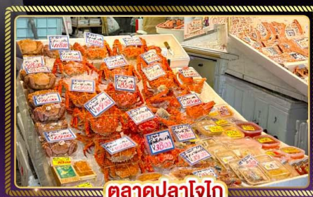
ตลาดปลาโอไก