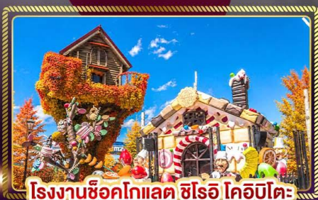
โรงงานช็อคโกแลต ชิโรอิ โคอิบิโตะ