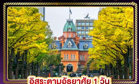
อิสระตามอัธยาศัย 1 วัน

น้ำหนักกระเป๋า 20 Kg. บริกอาหาร บนเครื่อง ไป-กลับ