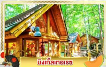
นิงเกิ้ลทอเรซ