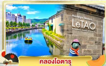
คลองไอตารุ