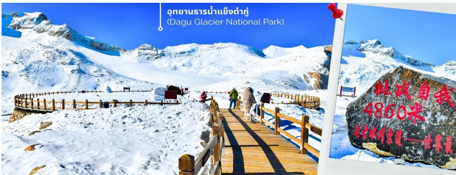
การตกและความหนาวของหิมะขึ้นอยู่กับสภาพอากาศ

จากนั้นนำท่านเดินทางสู่ เมืองเฮยสุ่ย (ใช้เวลาเดินทางประมาณ 2.5 ชั่วโมง) เพื่อเดินทางไปยัง อุทยานธารน้ำแข็งต้ากู่ปังชว่น (รวมกระเช้าขึ้นลง) ต้ากู่ปังชว่น หรือ Dagu Glacier National Park เป็นธารน้ำแข็งลาเซียร์ที่สวยงามที่สุดแห่งหนึ่งของโลก และเป็นสถานที่ท่องเที่ยวระดับ 4A ของจีน ตั้งอยู่ที่เมืองเฮยสุ่ย ในมณฑลเสฉวน ห่างจากเมืองเฉิงตูประมาณ 300 กิโลเมตร ถือเป็นธารน้ำแข็งที่อายุน้อยที่สุด ที่ตั้งอยู่ในระดับความสูงที่ต่ำที่สุด และอยู่ใกล้กับเมืองมากที่สุดในบรรดาธารน้ำแข็งทั้งหมด โดยอยู่สูงจากระดับน้ำทะเลประมาณ 3,800-5,100 เมตร จุดสูงที่สุดที่นักท่องเที่ยวสามารถขึ้นไปได้จะอยู่ที่ 4,860 เมตร