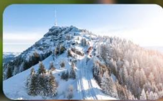
พิชิต 3 ยอดเขาดัง Rigi / Schilthorn / Gornergrat