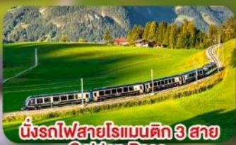
นั้รถไฟสายโรแมนติก 3 สาย Golden Pass / Luzern Interlaken Express / Gornergrat