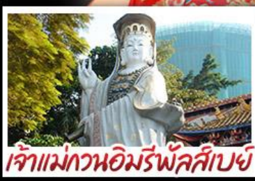
เจ้าแม่กวนอิมรีพลัสเบย์