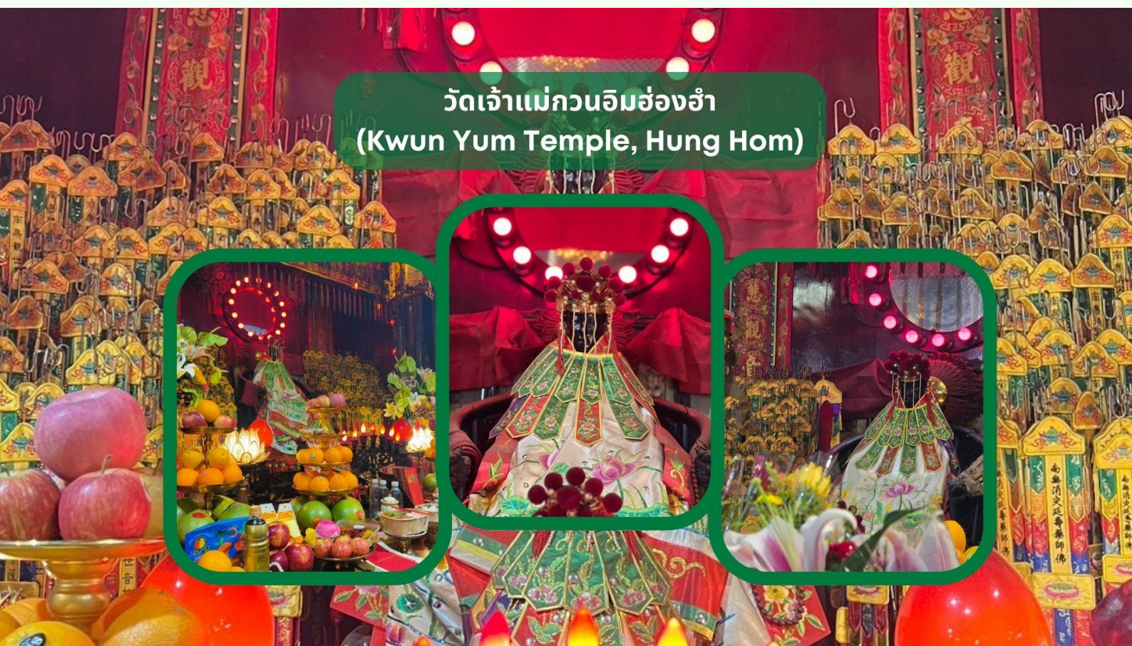
วัดเจ้าแม่กวนอิมฮ่องกง (Kwun Yum Temple, Hung Hom)

นำท่านเดินทางสู่ วัดเจ้าแม่กวนอิมฮ่องกง (Kwun Yum Temple, Hung Hom) เป็นวัดเล็กๆ อันเก่าแก่ ถูกสร้างมาตั้งแต่ปี พ.ศ. 2416 วัดนี้เคยมีปาฏิหาริย์เกิดขึ้น เมื่อช่วงสงครามโลกครั้งที่ 2 มีการปล่อยระเบิดลงบริเวณวัดฮ่องกงหลายต่อหลายครั้ง ซึ่งทำให้มีผู้บาดเจ็บล้มตายเป็นจำนวนมากทว่าชาวบ้านที่เข้าไปหลบภัยในวัดฮ่องกงกลับปลอดภัยไม่ได้รับความบาดเจ็บ รวมถึงตัววัดก็ไม่ได้ได้รับความเสียหายแบบน่าเหลือเชื่อ จึงทำให้