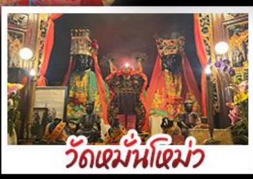
วัดเขม่านโหล่ว