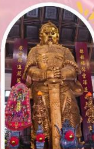
วัดแซกง ขอพรโชคกลาง การเงิน และธุรกิจ