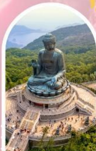
นั่งกระเชานองปิง นมัสการพระใหญ่ไป่หวลัน