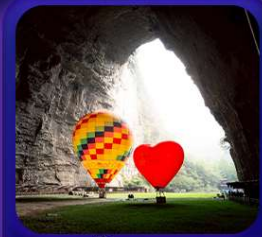
“ ถ้าเถิงหลง ”