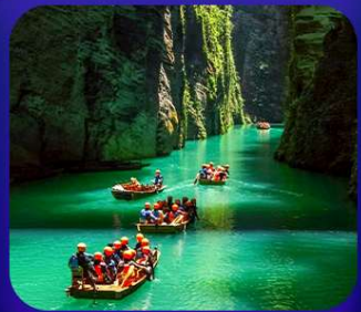
“ ผิงซานแกรนด์แคนย่อน ”

เที่ยวจีน 2 มณฑล เสฉวน+หูเป่ย์ • ถ้าเถิงหลง • หุบเขาสิงโต ซื่อจื่อกวน ล่องเรือมังกรกังส่วยชมวิวยามค่ำคืน • ผิงซานแกรนด์แคนย่อน (รวมล่องเรือ) หงหยาดัง • จุดชมรถไฟฟ้าทะลุทิว • ตึกตะเทียบ • สือปาตี • หลงเหมินฮ่าว