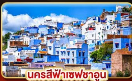
นครสีฟ้าเชฟชาอูน

📅 เดินทาง: 18-27 ต.ค. | 02-11 ธ.ค. 69 27 ธ.ค. 69 - 05 ม.ค. 70