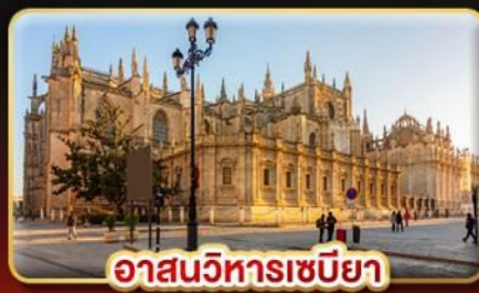
อาสนวิหารเซบิยา