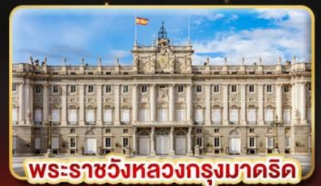
พระราชวังหลวงกรุงมาดริด