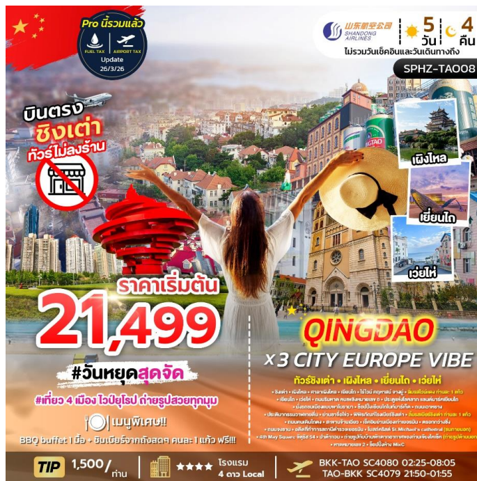
SPHZ-TAO08 QINGDAO X 3 CITY EUROPE VIBE 5 วัน 4 คืน เดินทางด้วยสายการบิน Shandong Airlines (SC)