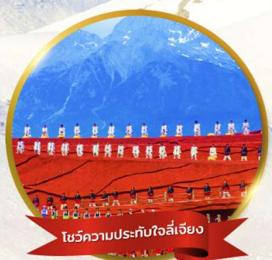
โซว์ความประทับใจลี่เจียง