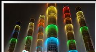
น้ำพุไม้ไผ่ตึกSKP