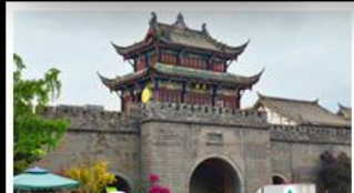
เมืองโบราณทวนเซี่ยน

ภูเขาสดรุณี - อุทยานป่ฝิงโกว - สะพานหมานเฉียว - ร้านหนังสือจงซูเก้อ - เมืองโบราณกวนเสียน จตุรัสหยางเทียนหวู่ - หมีแพนด้าเซอพี - ถนนโบราณชอยกวางชอยแคบ - ถนนคนเดินไท่กู๋หลี่ ถนนคนเดินซุนซี - ถนนโบราณจินหลี่ - แพนด้ายักษ์ปิ่นตึก - น้ำพุไม้ไผ่ตึกSKP - วัดต้าอ้อ