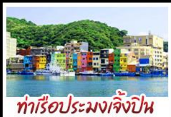
ทำเรือประมงเจิ้งปิ่น

รถไฟสายโบราณอาลีซาน - ตักไทเป 101 ประมงเจิ้งปิ่น - จิวเฟิ่น - ล่องเรือทะเลสาบสุริยันจันทรา ถนนเมบูเค็ด เสี่ยวหลงเป่า & ปลายประธาราฮิบตี ช้อปปิ้ง 3 ย่านดัง : ซีเหมินตง - ไถจงไนท์มาร์เก็ต - MITSUI OUTLET