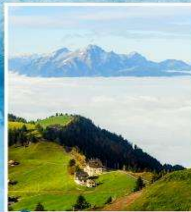
RIGI KULM Queen of the Mountains