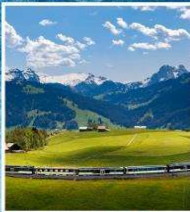
GOLDEN PASS LINE Montreux-Zweisimmen