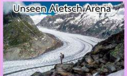
Unseen Aletsch Arena

ชมความงดงามของทะเลสาบเจนีวา ชมปราสาทชิลองที่เมืองมอว์คเทออร์ช ล่องเรือชมความงามของทะเลสาบลูเซิร์น, พักในหมู่บ้านเซอร์แมท (เมืองตากอากาศปลอดมลพิษ ที่ได้ชื่อว่าสวยงามเหมือนสวรรค์บนดิน)