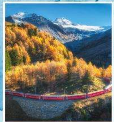
BERNINA EXPRESS Unesco

ออกเดินทาง 22-30 ต.ค. / 31 ต.ค.-08 พ.ย. 69