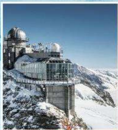
JUNGFRAUJOCH "Top of Europe"