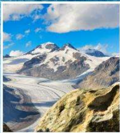
ALETCH GLACIER Riederalp, Bettmeralp