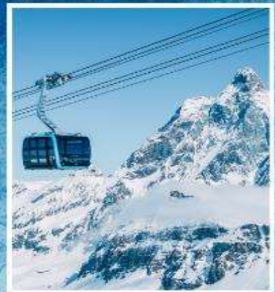
GLACIER PARADISE TOP OF ZERMATT