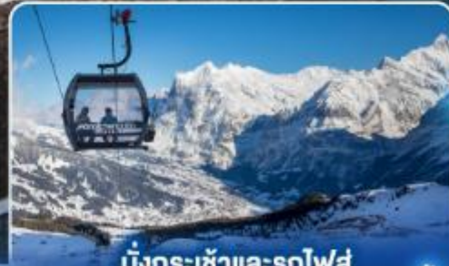
นั่งกระเช้าและรถไฟสุด อลเวงจากจุงเฟรา