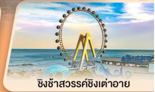
ชิงช้าสวรรค์ซิงต้าอาย