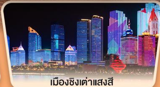
เมืองซิงต้าแสงสี