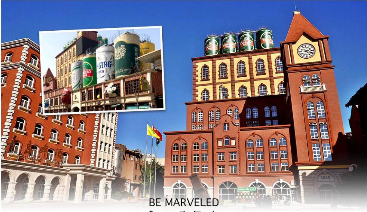
BE MARVELED โรงงานเบียร์สิงห์