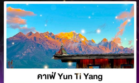
คาเฟ่ Yun Ti Yang