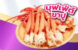
บุฟเฟ่ต์ ซาชิมิ