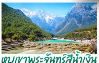
ภูเขาพระจันทร์สีน้ำเงิน