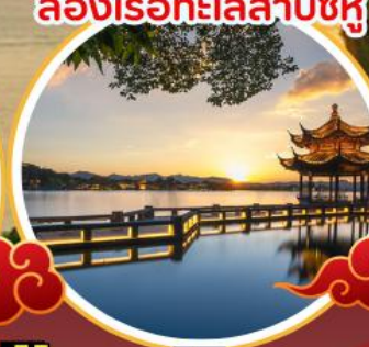
ล่องเรือทะเลสาบชิงหู