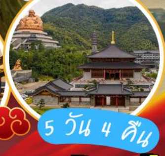
ภูเขาเสวียโต้วซาน