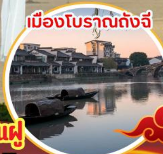
เมืองโบราณดั่งจี