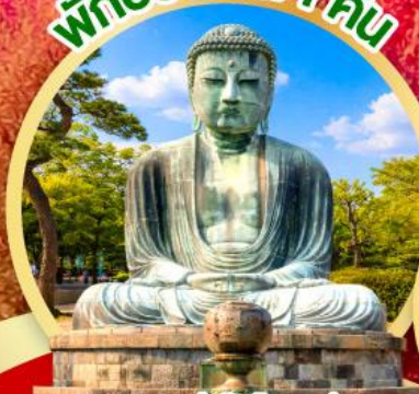
หลวงพ่อดโต โดบุตสึ