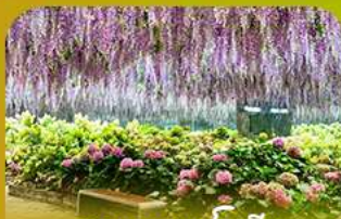
สวนนกเปาเม็ย