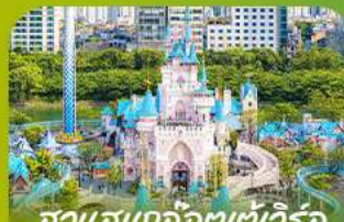
สวนสนุกโลกเทเวีร์ล Lotte Adventure World