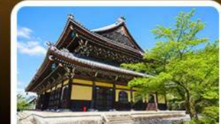
วัดนินเซ็นจิ