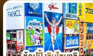
ช้อปปิ้งชินไซบาชิ และโดตงโบริ