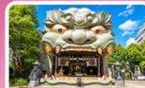
ศาลเจ้าอิมบะ ยาชากะ