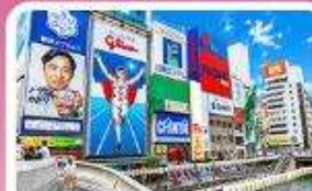
ชิบไซบาชิ