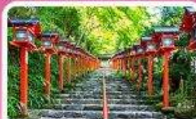
ศาลเจ้าอิฟุเนะ