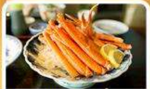
พิเศษ! ซาซู