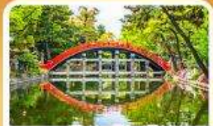
ศาลเจ้าสุมิโยชิ โกเบ