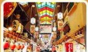
ตลาดปลานิชิกิ