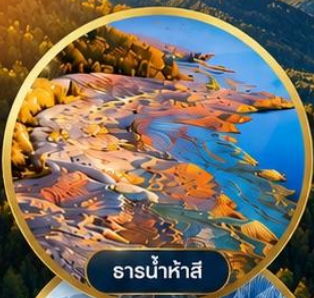
ธารน้ำห่าสี

中国南方航空 CHINA SOUTHERN AIRLINES 8 DAY 7 NIGHT