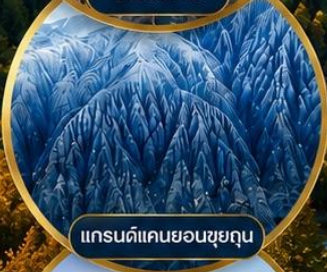
แกรนด์แคนยอนซูยถุน