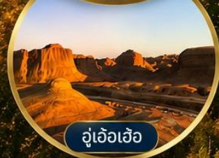
อู่เจ้อเอ้อ