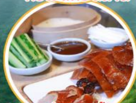
เป็ดปักกิ่ง + สุกี้มองโกล