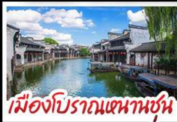
เมืองโบราณหนานชุน

DISNEYLAND SHANGHAI เต็มวัน เมืองโบราณหนานชุน (รวมล่องเรือ) - วัดจิ่งอัน เมืองโบราณหนานชุน - ตลาดร้อยปีฉิงหวังเหมียว มือพิเศษ บุฟเฟ่ต์ BBQ, เสี่ยวหลงเปา