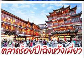
ตลาดร้อยปีฉิงหวังเหมียว