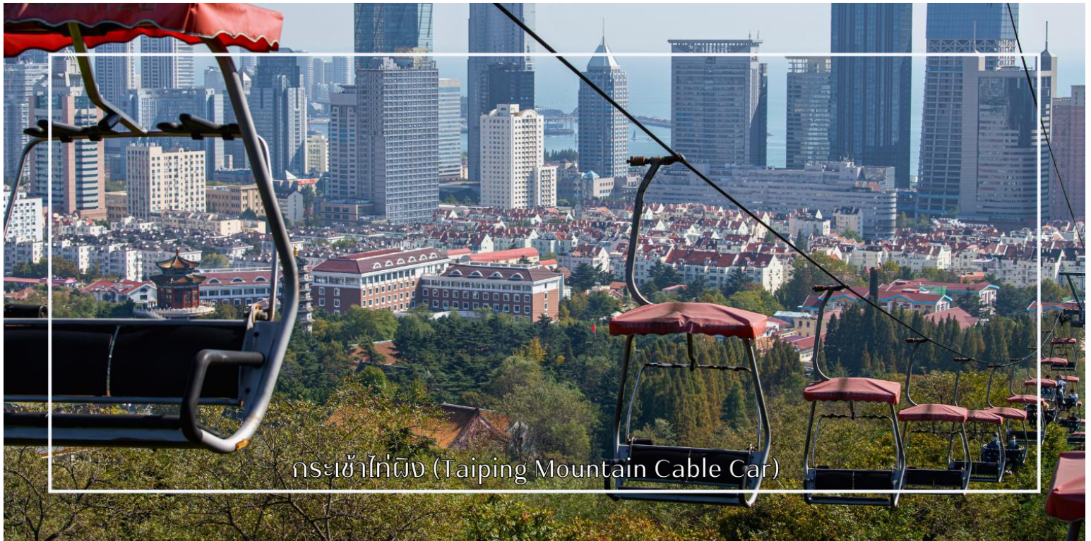
กระเช้าไทผิง (Taiping Mountain Cable Car)

นำท่านสู่ กระเช้าไทผิง (Taiping Mountain Cable Car) (รวมค่ากระเช้า) หนึ่งในกิจกรรมท่องเที่ยวยอดนิยมของเมืองชิงเต่า ตั้งอยู่บริเวณภูเขาไทผิง ซึ่งเป็นจุดชมวิวสำคัญของเมือง นำท่านโดยสารกระเช้าลอยฟ้าขึ้นสู่จุดชมวิวด้านบน เพื่อสัมผัสทัศนียภาพอันงดงามของตัวเมืองชิงเต่า ทะเลสีคราม และแนวชายฝั่งที่ทอดยาวอย่างตระการตา ระหว่างการโดยสารกระเช้า ท่านจะได้ชมวิวมุมสูงของผืนป่า อาคารบ้านเรือนสไตล์ยุโรป และภูมิประเทศที่ผสมผสานระหว่างภูเขากับทะเลอย่างลงตัว บรรยากาศที่สงบและอากาศบริสุทธิ์ ทำให้เป็นประสบการณ์ที่ทั้งผ่อนคลายและน่าประทับใจ