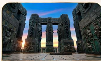
อนุสรณ์ประวัติศาสตร์จอร์เจีย