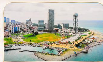
เมืองชายทะเล บาดูมี