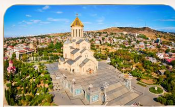
โบสถ์กรินิตี