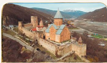
ป้อมอนาบุรี