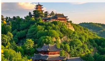
เขาเหยาหวังซาน