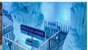
ถ้ำน้ำแข็งอวีนชีวซาน

*ทางบริษัทฯ ขอสงวนสิทธิ์ในการสลับโปรแกรมทัวร์ตามความเหมาะสมขึ้นอยู่กับสถานการณ์หน้างาน โดยคำนึงถึงผลประโยชน์ของลูกค้าเป็นสำคัญ