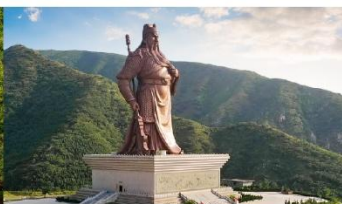
บ้านเกิดกวนอู