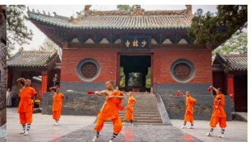
ชมโชว์กังฟูเล่าหลิน

*ทางบริษัทฯ ขอสงวนสิทธิ์ในการสลับโปรแกรมทัวร์ตามความเหมาะสมขึ้นอยู่กับสถานการณ์หน้างาน โดยคำนึงถึงผลประโยชน์ของลูกค้าเป็นสำคัญ