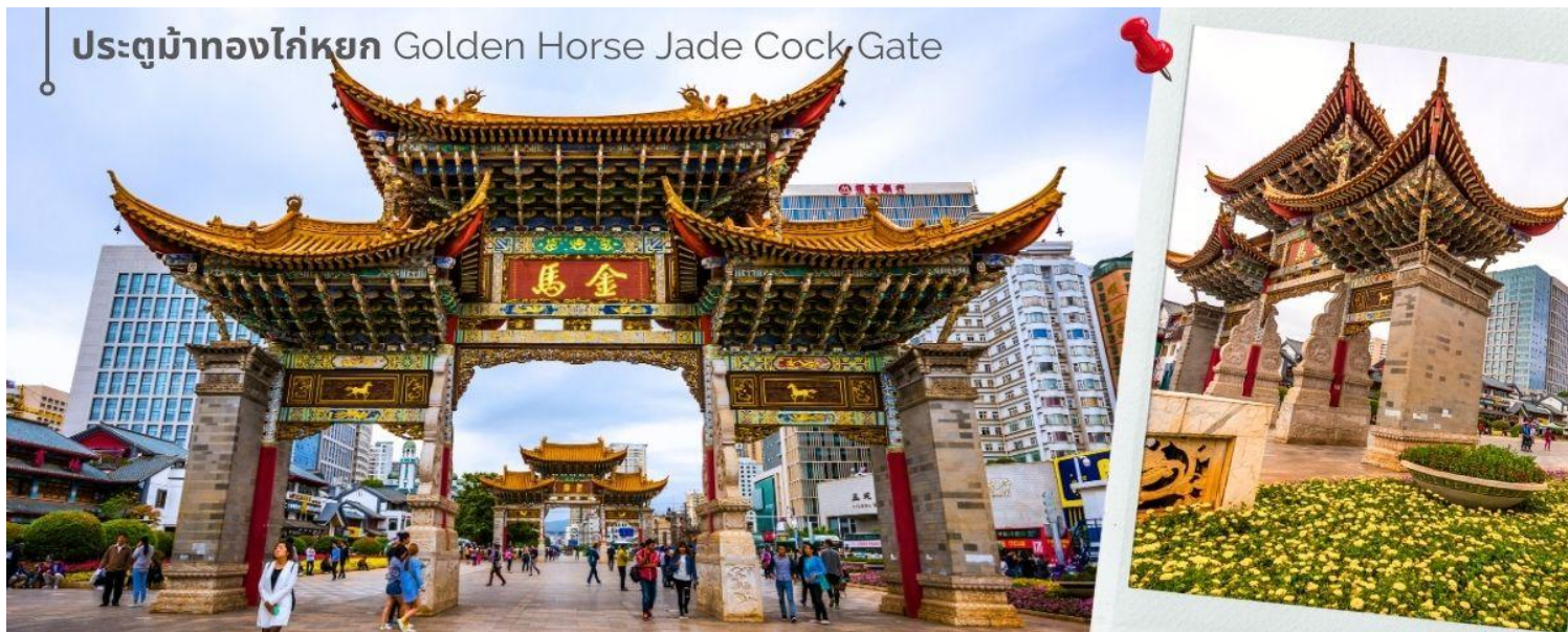
ประตูม้าทองไก่อหยก Golden Horse Jade Cock Gate

ค่า 🎯 รับประทานอาหารค่ำที่ภัตตาคาร (14) 🏠 เดินทางเข้าที่พัก LONGWAY HOTEL ระดับ 4 ดาวหรือเทียบเท่า