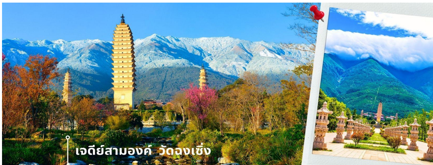
เจดีย์สามองค์ วัดฉงเซิง

จากนั้นผ่านชม เจดีย์สามองค์ สัญลักษณ์ของเมืองต้าหลี่ ตั้งอยู่ใน วัดฉงเซิง (Chongsheng Temple) วัดเก่าแก่ที่สร้างขึ้นเมื่อศตวรรษที่ 9 นับว่าเป็นหนึ่งในเจดีย์ที่สูงที่สุดในประเทศจีน อีกทั้งยังมีความศักดิ์สิทธิ์เป็นอย่างมาก ว่ากันว่าเป็นหนึ่งในสิ่งก่อสร้างเพียงไม่กี่แห่งที่ไม่ถูกทำลายจากเหตุการณ์แผ่นดินไหวในเมืองต้าหลี่เมื่อปี ค.ศ. 1925 จึงกลายเป็นสถานที่เคารพศรัทธาของชาวต้าหลี่เป็นอย่างมาก