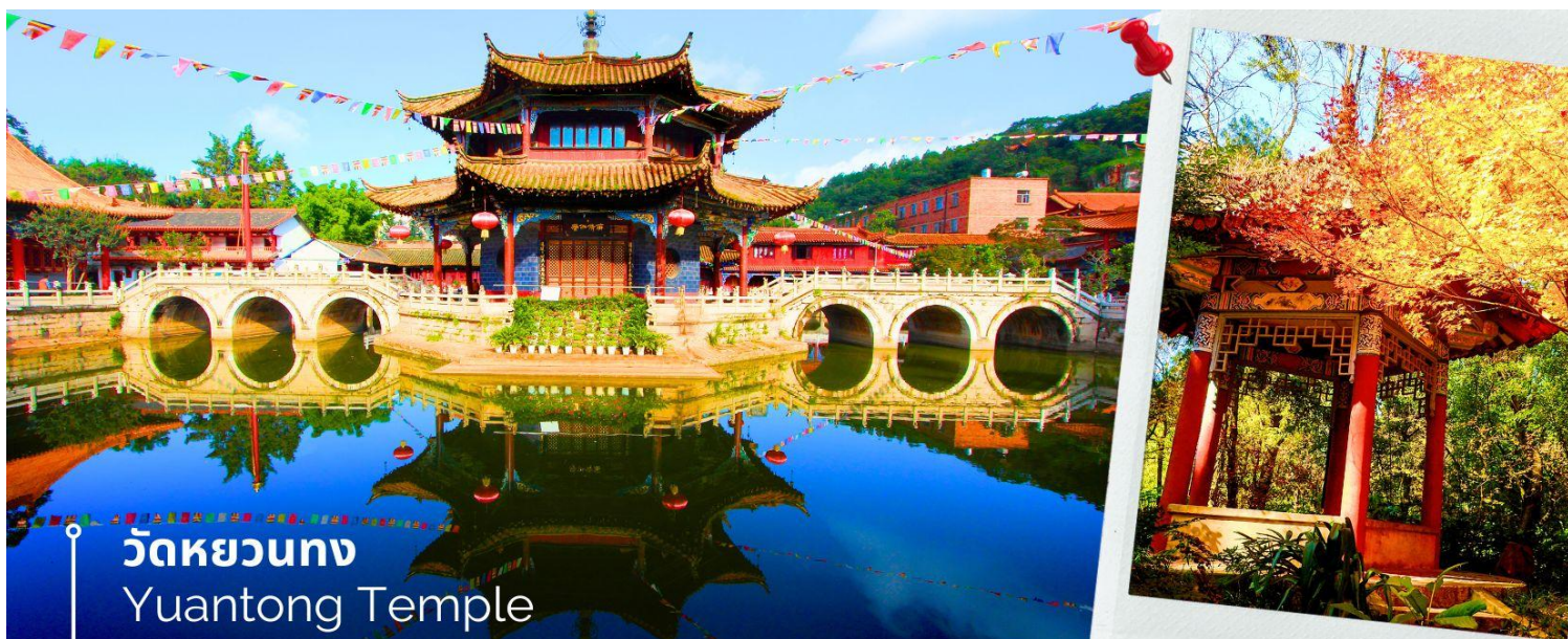
วัดหยวนทง Yuantong Temple

เช้า 🎯 รับประทานอาหารเช้า ณ ห้องอาหารโรงแรม (15) นำท่านชม วัดหยวนทง (Yuantong Temple) วัดแห่งนี้เป็นวัดที่ใหญ่และเก่าแก่ที่สุดในเมืองคุนหมิง สร้างมาตั้งแต่สมัยราชวงศ์ถัง มีอายุยาวนานประมาณ 1,200 กว่าปี การสร้างวัดแห่งนี้จะแปลกตากว่าวัดอื่นในจีน เพราะปกติแล้วการสร้างวัดของจีนส่วนมากจะต้องสร้างอยู่บนภูเขา แต่วัดหยวนทงสร้างวัดต่ำกว่าภูเขา โดยวิหารจะอยู่ต่ำที่สุดเนื่องจากวัดแห่งนี้ไม่ได้สร้างขึ้นเพื่อเป็นวัดโดยตรง แต่เคยเป็นศาลเจ้าแม่กวนอิมมาก่อน