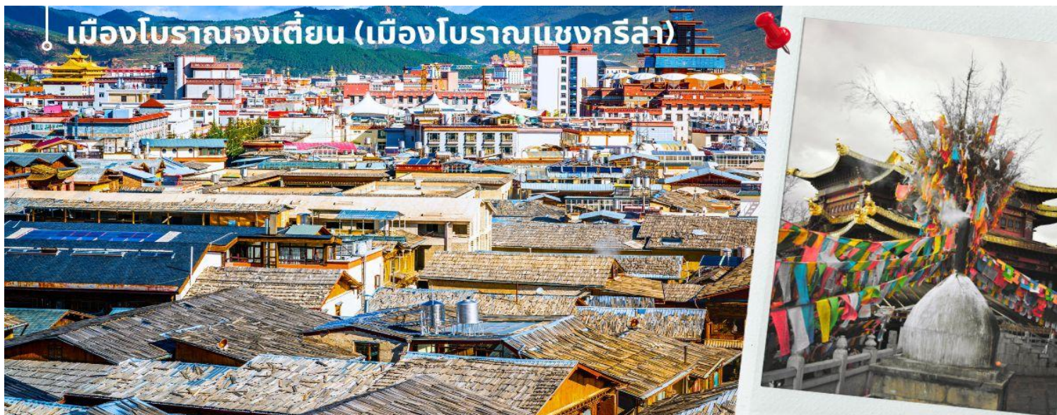
เมืองโบราณจงเตี้ยน (เมืองโบราณเซงกรี่ล่า)

นำท่านชม เมืองโบราณจงเตี้ยน (เมืองโบราณเซงกรี่ล่า) ตั้งอยู่ในเขตปกครองตนเองชนชาติทิเบต ตีซิ่ง ทางตะวันตกเฉียงเหนือของมณฑลยูนนาน ที่ราบสูงทางภาคตะวันตกเฉียงใต้ของประเทศจีน มีชนชาติส่วนน้อย 25 ชนชาติอาศัยกันอยู่ อาทิ ชนชาติทิเบต ลีซอ น่าซี ไป และอี เป็นต้น ศูนย์รวมของวัฒนธรรมชาวทิเบต ลักษณะคล้ายชุมชนเมืองโบราณทิเบต ซึ่งเต็มไปด้วยร้านค้าของคนพื้นเมือง ร้านขายสินค้าที่ระลึกมากมาย