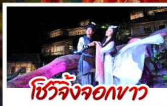
ชีวิตจิ้งจอกขาว