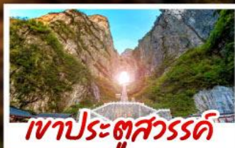
เขาประตูลสวรรค์